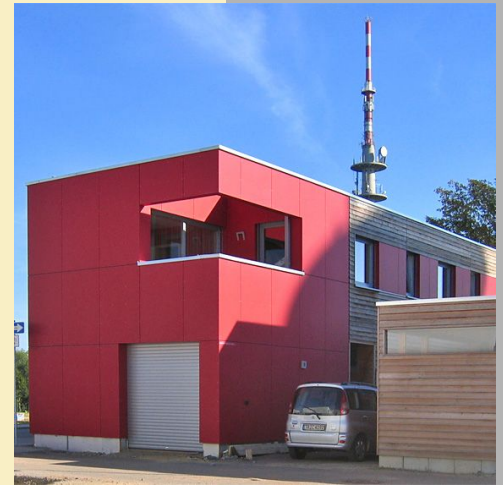
Hofhaus in Trier, Schuh + Weyer Architekten