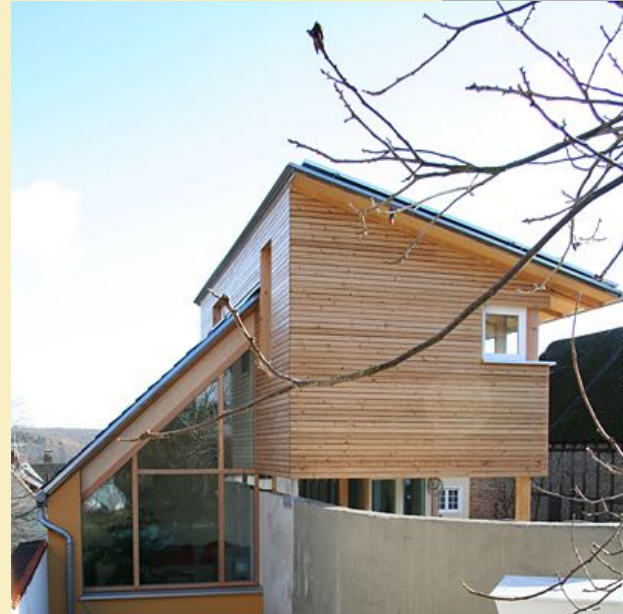
Hofhaus im altem Ortskern von Rauenthal, Architekt C. Dahl

Das Hofhaus wird sich aber nicht von allein durchsetzen, da es als Neubautyp noch zu wenig präsent ist und wenig Beispiele gibt. Bei Neubaugebieten muß der Bebauungsplan speziell auf Hofhäuser zugeschnitten werden. Der Straßenraum, die Anordnung von Stellplätzen, die Struktur der Häuser muß beim Hofhaus viel sorgfältiger geplant werden. Der Verzicht auf die Abstandsfläche bereitet immer wieder baurechtliche Hindernisse. Es gibt also erhebliche Anfangswiderstände.