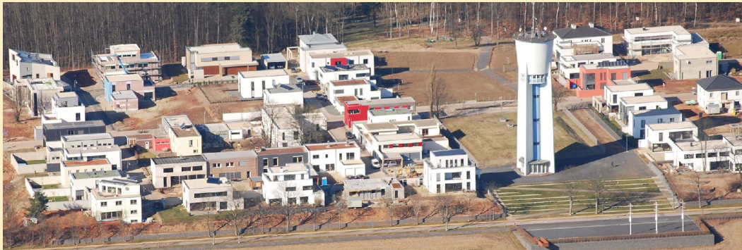
Trier, Petrisberg : Siedlung mit Hofhäusern

Geplant sind dazu : Öffentlichkeits- und Verbandsarbeit, Broschüren, und Vorträge. Eine Homepage wurde eingerichtet die mit der Zeit zu einem Forum für Hofhausplanung entwickelt werden soll.