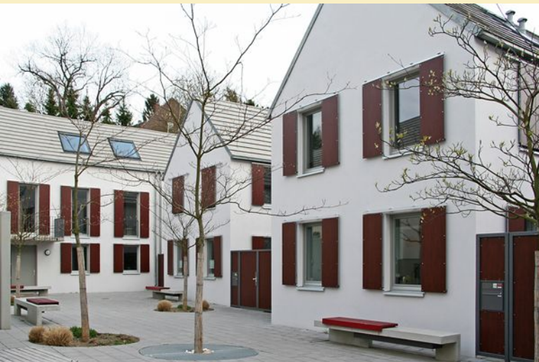
Gruppe mit 9 Hofhäusern in Mainz-Hechtsheim, Wohnbau Mainz, T. Weyel; Doss + Over, Architekten

In Mainz-Hechtsheim ist gerade eine durch die Wohnbau Mainz errichtete Hofhausgruppe mit dem Staatspreis des Bundeslandes ausgezeichnet worden. Jedes Haus hat seinen privaten Hof obwohl die Grundstücksfläche pro Haus nur wenig über 120m 2 liegt.