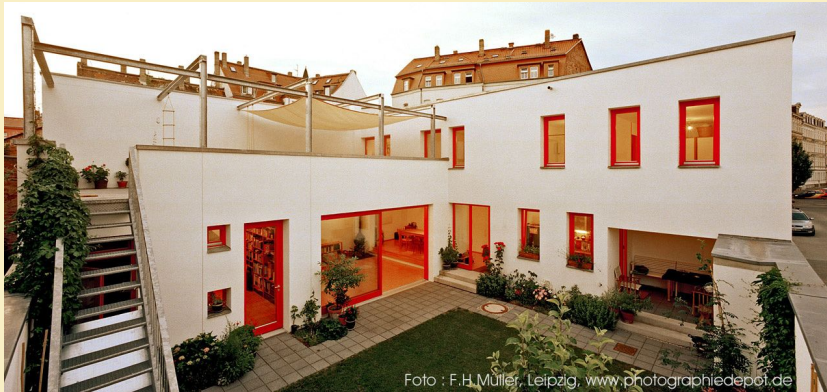
Hofhäuser in Leipzig von Hertrampf und Niehus

In Leipzig haben die Architekten Hertrampf & Niehus in der Pfeffingerstraße eine Gruppe von vorbildlichen Hofhäusern errichtet.